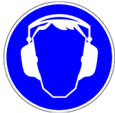
Lärbereich, Lärmschutz tragen